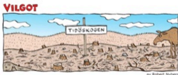
Tolkning 2 av dagens skogsbruk. VILGOTs tolkning.